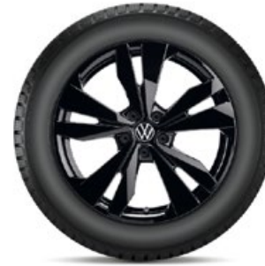
VW Loen Schwarz