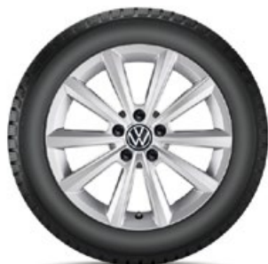
VW Merano Silber

1 Für Fahrzeuge mit Ausstattung „direkt messendes Reifendruckkontroll-System RDKS“