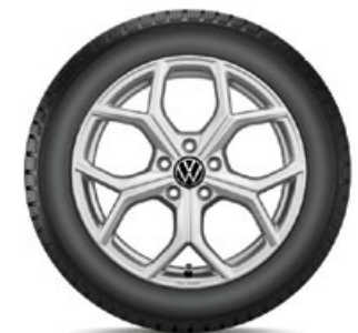
VW Huntsville Silber

Alle abgebildeten Winterkomplettäder (WKR) für den neuen Tiguan haben keine Reifendruckkontroll-Sensoren (RDKS). Falls Ihre Fahrzeugausstattung dies erfordert, sind WKR mit RDKS zu wählen. Beachten Sie bitte den Aufpreis. Ihr Volkswagen Service-Betrieb informiert Sie gerne.