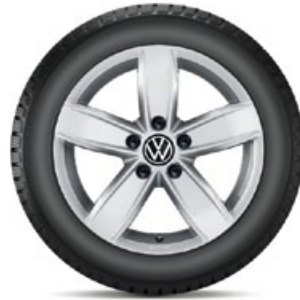
VW Corvara Silber