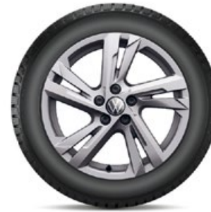
VW Valencia Grau