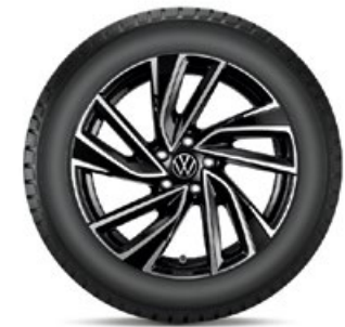
VW Adelaide Schwarz