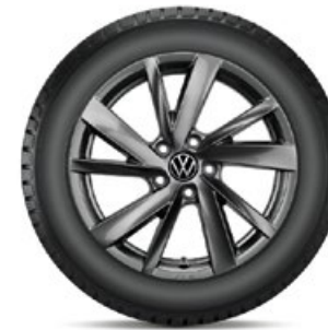
VW Gavia Adamantium Dark