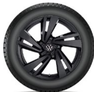
VW Nevada Schwarz

Alle Preise auf dieser Seite sind unverb., nicht kart. Richtpreise in Euro inkl. MwSt. exkl. Einbau/Montage.