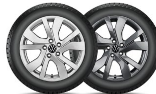
VW Rockingham Silber

VW Huntsville Silber für den neuen Tiguan in 19" mit 235/50 R19 103V XL Bridgestone Blizzak LM005 statt 3.600,- mit TopCard 2.700,- KE: C | NHK: A | GE: 72 | GE/G: B | SK-F: Nein Art.-Nr. 2355019HV40005