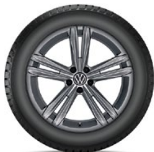
VW Sebring Grau