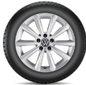
VW Merano Silber

Alle Preise auf dieser Seite sind unverb., nicht kart. Richtpreise in Euro inkl. MwSt. exkl. Einbau/Montage.